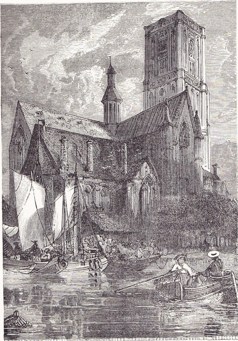
Cathédrale Saint-Laurent, à Rotterdam.

c'était de la glace à perte de vue, et à une demi-lieue de nous, bien empêtrés et bien immobiles dans les glaçons,